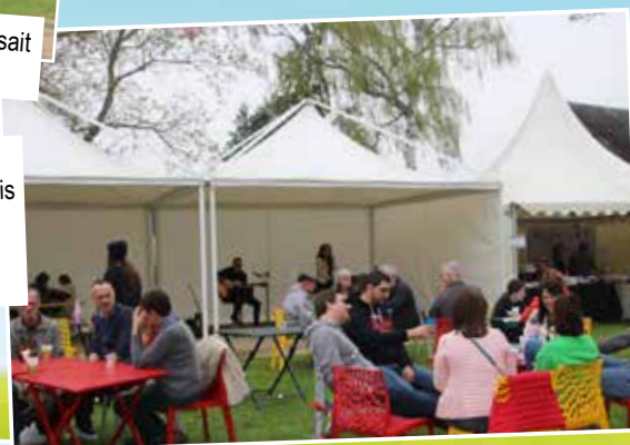
Après s'être produit sur la scène ouverte du mois de mars, le duo acoustique londonais K-Myster-Y vous a accompagnés sur la terrasse le samedi après-midi avec son répertoire de chansons françaises.