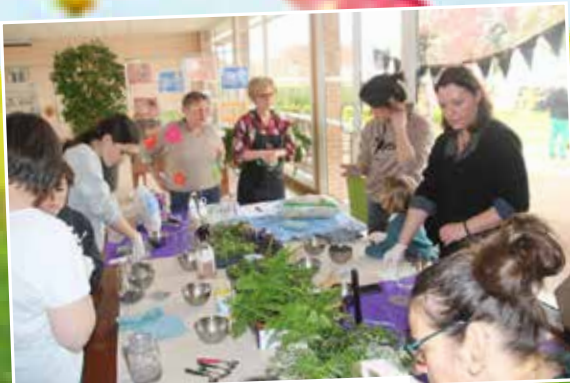
L'Association Chic Planète vous donnait rdv en duo pour fabriquer un terrarium.