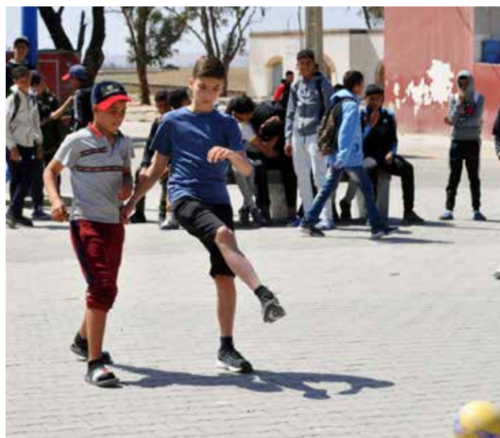
La rencontre imprévue entre les jeunes Londais et les collégiens du village s'est terminée par un match de foot

Pour finir, un grand merci à ce peuple marocain qui fait preuve chaque jour de dignité malgré l'adversité et de bienveillance envers les autres.