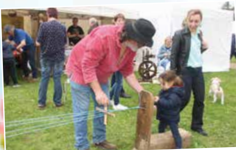
La Ferme du Mathou proposait un atelier de cordage. Une belle découverte pour le public.