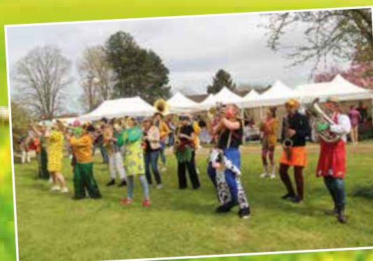
Le dimanche après-midi, les « Vashfol », groupe de musiciens futurs médecins ou accomplis ont enchanté les visiteurs par leur musique joyeuse et leurs costumes colorés.