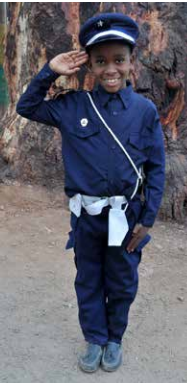
Même les forces de l'ordre étaient présentes

Mais avant ça, vous prenez l'arrivée sur la place centrale du village de six jeunes et 2 adultes descendant d'un véhicule en même temps que la sortie d'élèves du collège et grâce à cette coïncidence vous êtes témoin d'un moment insolite. Un attroupement de dizaines de jeunes autour de nous très surpris de nous voir débarquer. Après la prise de photos où chacun prend la pose et la curiosité passée, tout cela se termine après conciliabule par l'improbable organisation sur la place d'un match de foot, un sport qui relie tous les enfants du monde.