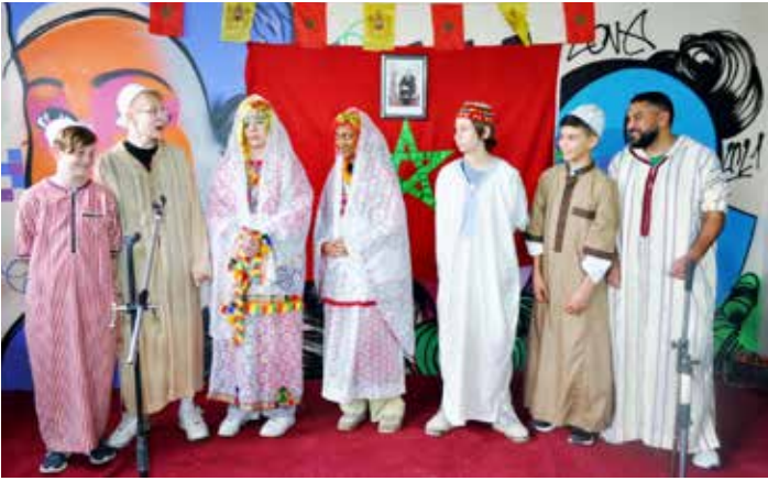
En costume traditionnel, elle n'est pas belle notre équipe !

accompagnés de Karim. De purs moments de bonheur et de partage qui nous laisseront des souvenirs indélébiles en se remémorant les nombreux sourires sur les visages de tous ces enfants.