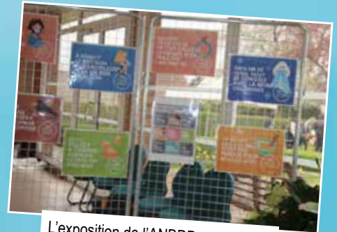
L'exposition de l'ANBDD sensibilisait le public à l'alimentation durable.