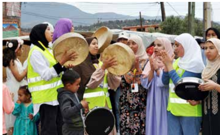
Un accueil dans le village d'Ouirgane digne d'un chef d'État.

Leur présence active à la « buvette » lors des différentes manifestations qui se sont déroulées à La Londe (les Rendez-vous aux Jardins, la Dictée Londaise, la foire à tout du 1er mai et le concert à la salle des fêtes) avec la vente de soupe, sandwichs, crêpes (merci à papa et maman pour leur participation à la fabrication) et boissons... a porté ses fruits et les sommes récoltées sont venues grossir la cagnotte. Mais le secteur privé n'a pas été en reste avec la participation de l'entreprise Sopano (créateur et fabricant d'étiquettes) de Saint-Pierre-lès-Elbeuf et du cabinet « Boucle de Seine Architecture » d'Elbeuf qui ont également apporté activement leur soutien à cette initiative.