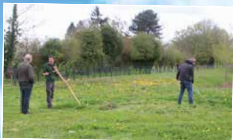
L'Association Titricum vous faisait découvrir les outils anciens avec séance pratique et proposait des jeux de reconnaissance de graines et une mini meunerie.