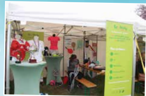
Ecology ou l'art de recycler les articles de sport qui dorment dans vos placards.