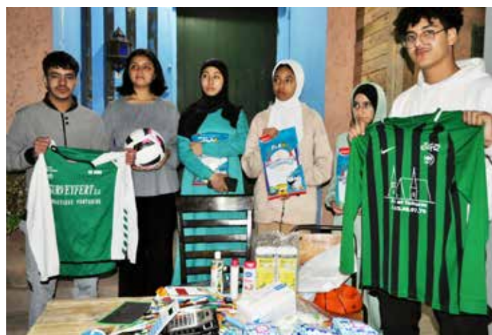
La dernière distribution est allée en direction du lycée Mohamed VI de Marrakech avec des fournitures scolaires, des produits d'hygiène et du matériel pour la pratique du sport.