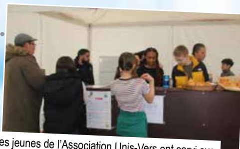
Les jeunes de l'Association Unis-Vers ont servi sur la terrasse, boissons et sandwiches variés afin de financer leur voyage humanitaire au Maroc.