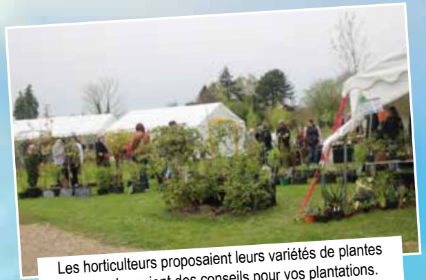
Les horticulteurs proposaient leurs variétés de plantes et vous donnaient des conseils pour vos plantations. Un troc de plantes était également à votre disposition pour échanger boutures et plants.

Le week-end des 6 et 7 avril, les jardins de la Mairie ont accueilli près de 2800 visiteurs pour fêter le printemps. Tout était réuni pour passer un agréable moment. Les différentes photos ci-après vous feront revivre les temps forts de cette manifestation.