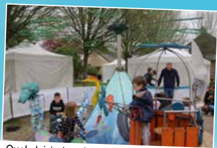
Quel plaisir de voir les parents pédaler pour faire tourner leurs enfants sur le manège proposé par l'Association Ludens.