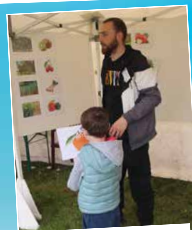
Julien du Service Jeunesse proposait au jeune public un jeu de reconnaissance sur les fruits et légumes.