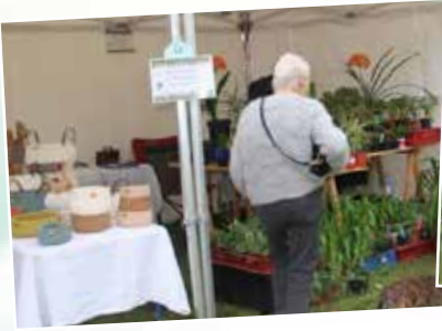
Les exposants proposaient artisanat et produits de qualité.