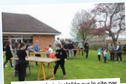
Les jeux en bois installés sur le site par l'Association Ludens ont fait le plaisir des enfants et des parents.