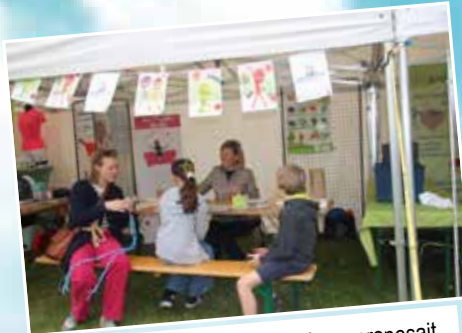
Camille des « Papilles Vocales » proposait des jeux culinaires autour de l'écologie.