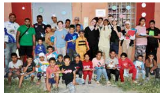
De nombreux enfants du village de Labkhathi ont pu également bénéficier d'une dotation généreuse.