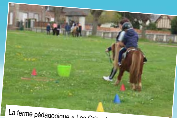
La ferme pédagogique « Les Crins de verdure » proposait une balade à poney sur la place de l'Ourail.