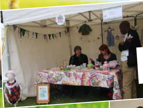
L'Association Renaître la recyclerie spécialisée dans la seconde vie des vêtements d'enfants et basée à Elbeuf souhaitait se faire connaître