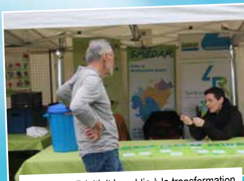
Le SMEDAR initiait le public à la transformation des emballages sans oublier les règles de tri de ses déchets