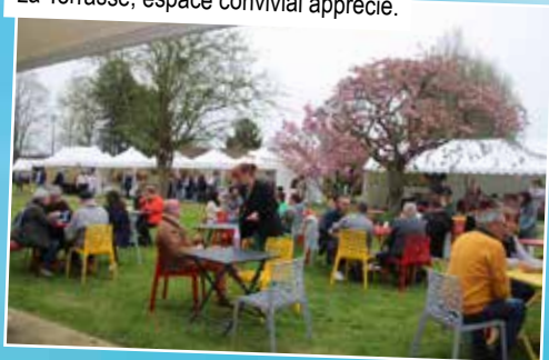
La Terrasse, espace convivial apprécié.