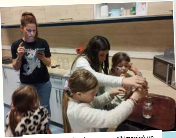
Hélène du Service Jeunesse avait imaginé un escape game intitulé « Cauchemar en cuisine ».