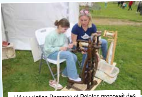
L'Association Pommes et Pelotes proposait des démonstrations de cardage et de filage de rouet. Objet insolite pour le jeune public !