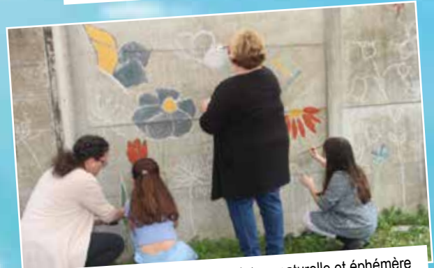
Elvine proposait un atelier de peinture naturelle et éphémère sur l'un des murs des jardins de la Mairie.